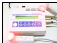
Sistema Quantum MILTA

www.quantumsalud.com quantumsalud@quantumsalud.com