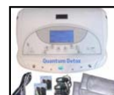
Sistema Quantum DETOX