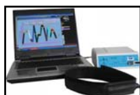
Sistema Quantum SCIO